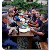
Grillabend zum 35.

Grillabend im Pfarrhof nach der Johannisandacht gefeiert. Am 24. Juni 1988 fand zur Johannisandacht der erste öffentliche Auftritt statt, seitdem wurde dieser Termin nie ausgelassen - hat somit die längste Tradition. Es gibt aber jedes Jahr auch