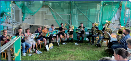
Andacht am Johannistag am 24.06.2023

Aktivitäten, die es vorher so in der Art nicht gab. So begleiteten wir einen Bibelwochenabend in der Lutherstube musikalisch und gestalteten im Sommer mit Seelingstädter Bläsern je einen Bläsergottesdienst in Seelingstädt und in Trünzig. Aber der Reihe nach - in den eher ruhigen Monaten Januar und Februar wurde teils neue