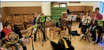
Der Posaunenchor nachwuchs probt

Besuch unserer Freunde vom Posaunenchor Kirchohsen am 29.10.2023. Die letzten zwei Monate im Jahr waren