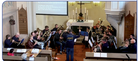
Posaunenchor aus Kirchohsen zu Gast

Literatur ausprobiert, teils altes aufgefrischt bevor das Bläserjahr im März und April mit den Vorbereitungen zur Konfirmation und den Gottesdiensten am Osterwochenende Fahrt aufnahm. Im Mai waren alle Posaunenchöre der ehemaligen Ephorie Werdau zum Jubiläumsgottesdienst „100 Jahre Posaunenchor Werdau“ eingeladen. Nach dem Himmelfahrtsgottesdienst in Trünzig waren wir am Pfingstwochenende zur Konfirmation in Berga auswärts unterwegs, gefolgt vom Gottesdienst zum Kinderfest im Trünziger Pfarrhof hier hatte der Bläsernachwuchs seinen ersten großen Auftritt. Anfang Juli „bestritten“ wir im Zelt einen „Bläsergottesdienst zur Jahreslosung“ in Seelingstädt, das wiederholten wir Ende August in Trünzig. Im September gestalteten wir den Gottesdienst zur Jubelkonfirmation in Teichwolframsdorf. Der Oktober begann musikalisch mit dem Erntedankfest und endete mit einem