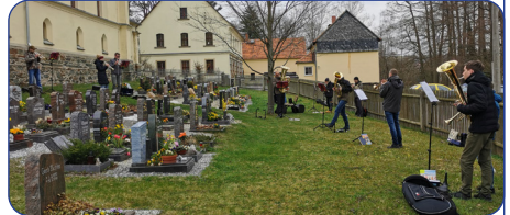
Ostersonntag vor der Kirche, 05.04.2021

Gemeinsame Proben gab es erst wieder kurz vor Ostern in Kleinstgruppen. In diesen Gruppierungen hatten wir am Ostersonntag und -montag die Möglichkeit im Ort, am Pflegeheim und vor der Kirche zu musizieren. Ende April gab es die erste gemeinsame