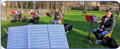
1. gemeinsame Probe im Jahr, 23.04.2021