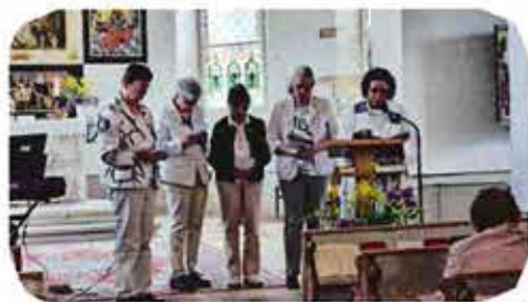
Rogatetreffen am 10. Mai 2026