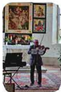
Die Kirchgemeindevertreter Langenbernsdorf

So klang ein gelungener Tag in herzlicher Gemeinschaft aus – und es bleibt die Vorfreude auf das Rogatetreffen im kommenden Jahr.